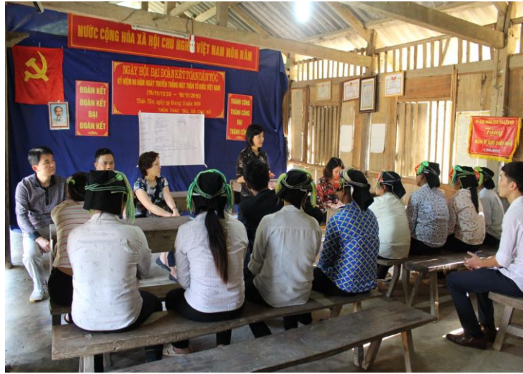
Ảnh 2: Thảo luận nhóm nam giới tại bản Thác Tậu, xã Cao Bồ, huyện Vị Xuyên, Hà Giang