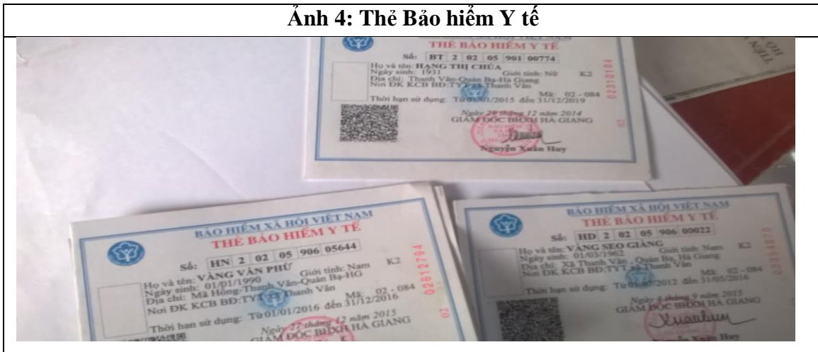
Ảnh 4: Thẻ Bảo hiểm Y tế

Một cán bộ quản lý BHXH hoặc lao động-xã hội đã chia sẻ rằng ở xã Thanh Vân, huyện Quỳnh Lưu, năm 2015 có hơn 10 thẻ bảo hiểm y tế bị trùng, một số trường hợp bị lỗi về thông tin trên thẻ bảo hiểm y tế và thẻ bị mất/ rách. Để được cấp thẻ/sổ mới thay thẻ, người sử dụng dịch vụ bảo hiểm y tế và bảo trợ xã hội phải trả khoảng một hơn hai nghìn đồng cho thẻ/sổ bị mất/rách. Mất ít nhất một tuần để nhận được thẻ/sổ thay thế. Thẻ/sổ thay thế chỉ được bàn giao cho người được cấp lại vào ngày đầu tiên của tháng.